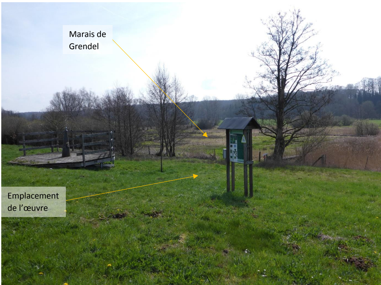
Figure 3: Emplacement de l'œuvre